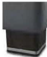
H 05-10 H 05-15 Holzfuß wengefarbig