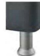
K01-10 K01-15 Kunststofffuß alufarbig