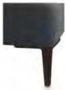
A11-10/M01 A11-15/M01 Alufuß schwarz matt