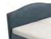
0334 Höhe 106 cm