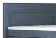
0025 Höhe 122 cm