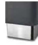
M 09-10 M 09-15 Metallfuß verchromt