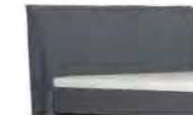
0801 Höhe 108 cm