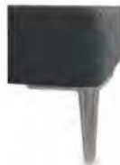
A11-10/M12 A11-15/M12 Alufuß gebürstet