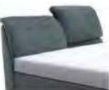
0852KV Höhe 112-123 cm nur lieferbar bei Bettgrößen 160-200cm Breite