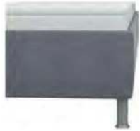
glatt Höhe ca. 29 cm Standard