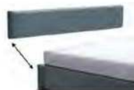
Kopfteilblende 3029 - Höhe 29 cm 3035 - Höhe 35 cm