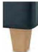
H17-10 H17-15 Holzfuß Buche natur lackiert