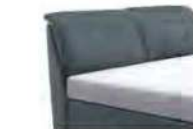
0852 Höhe 112 cm nur lieferbar bei Bettgrößen 160-200cm Breite