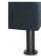
M24-10 M24-15 Metallfuß schwarz