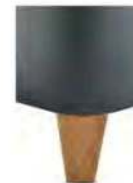
H25-10 H25-15 Holzfuß Eiche natur geölt