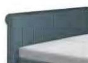
0276 Höhe 125 cm