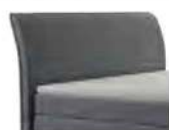
0022 Höhe 106 cm