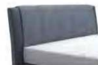
0378 Höhe 116 cm