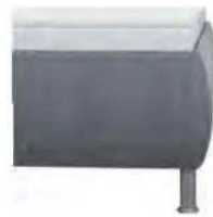
leicht bombiert Höhe ca. 35 cm