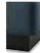
S01-10 S01-15 Bettsockel schwarz