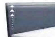
0300 Multimaß Höhe 55 - 125 cm in 5cm-Schritten kürzbar