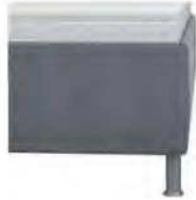
glatt Höhe ca. 35 cm