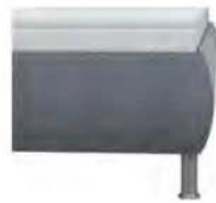
leicht bombiert Höhe ca. 29 cm