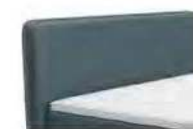
0383 Höhe 116 cm